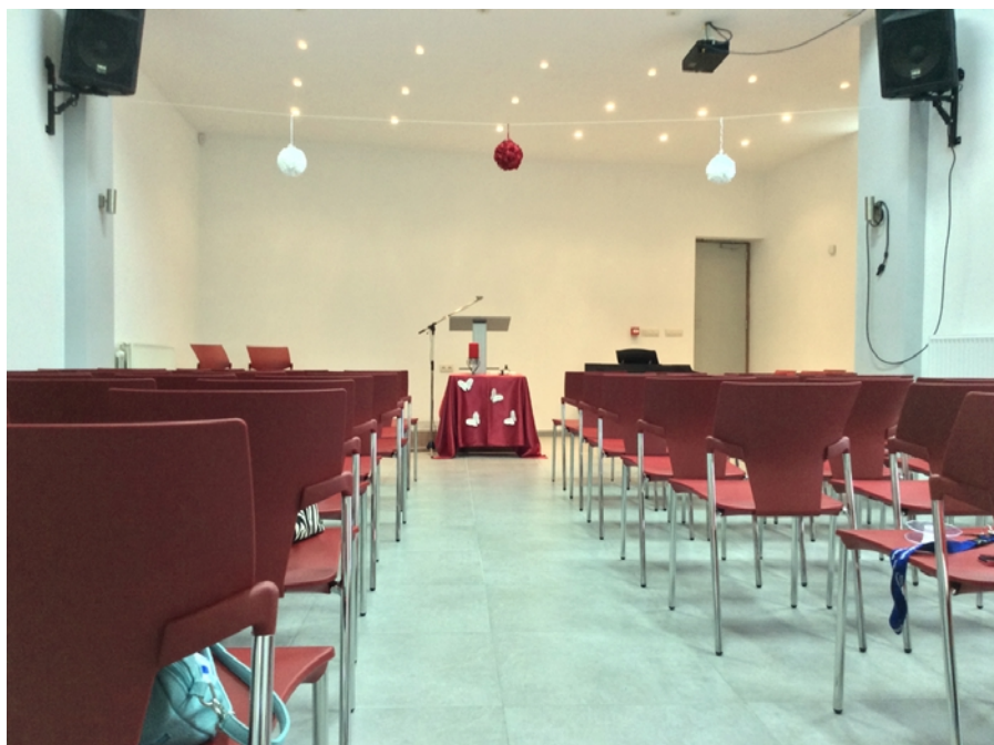
Vue depuis l'entrée de la salle.