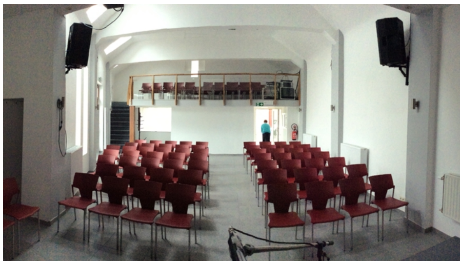
Vue panoramique vers le fond de la salle. On peut y distinguer le balcon.