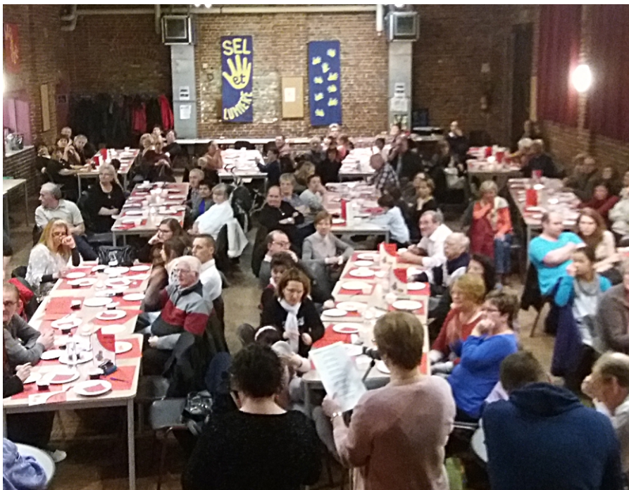
Salle Valère Motte, vue générale de l'assistance lors de notre 26 e Gala de Noël.